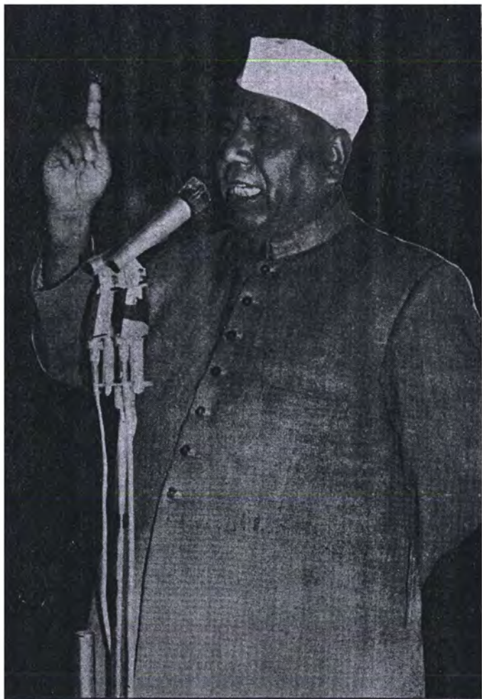
मा. यशवंतराव चव्हाण