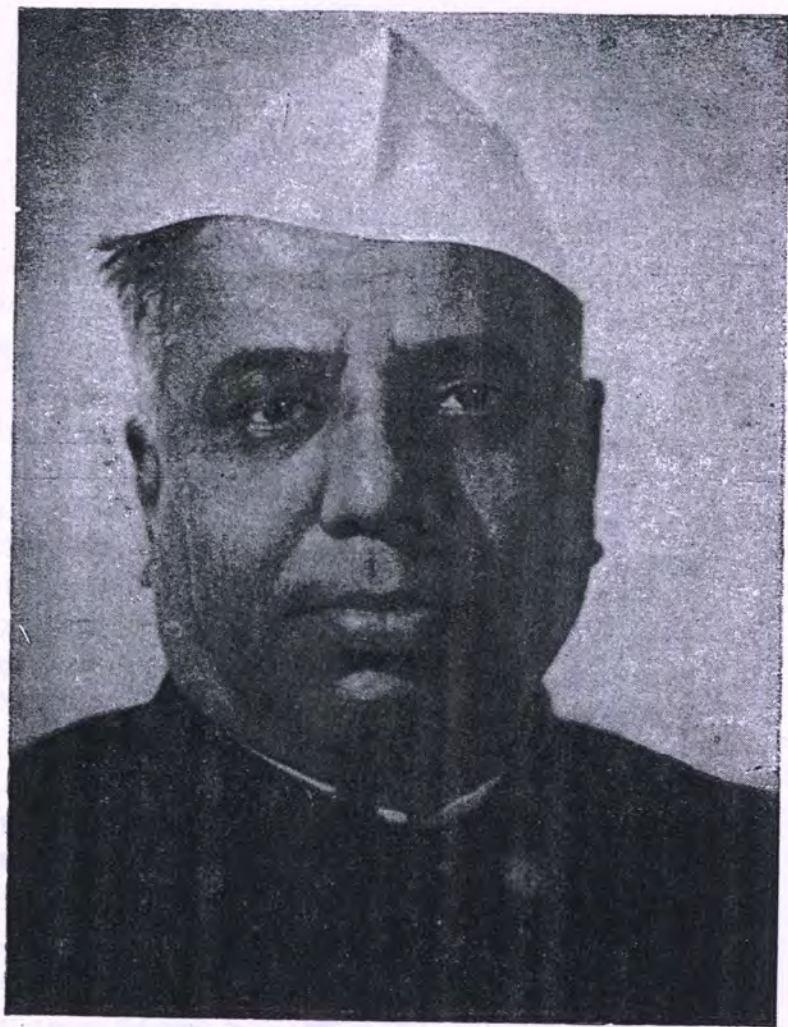
ना. यशवंतराव चव्हाण