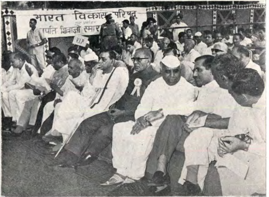
दिल्लीत छत्रपतींच्या पुतळ्याचे अनावरण