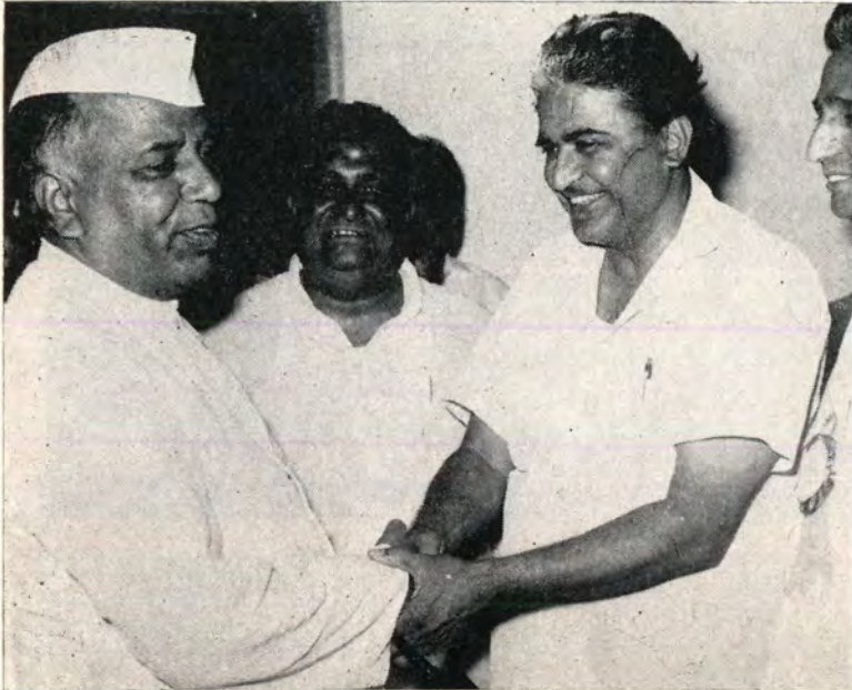
मराठमोळी साहित्य-संस्कृती समवेत ग. दि. मा., सी. रामचंद्र