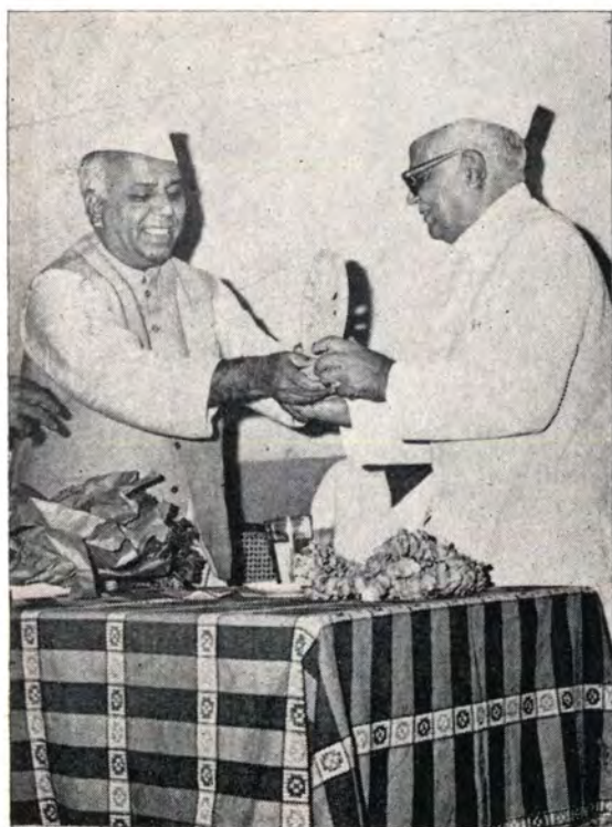
तर्कतीर्थाना 'पद्मश्री' लाभल्याचा आनंद