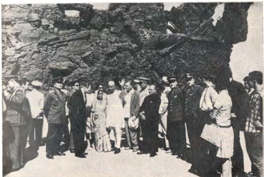
रशियातील युद्ध स्मारकाला चव्हाण पति-पत्नीची भेट