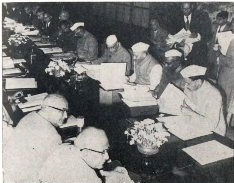
नॅशनल डिफेन्स कौन्सिलची बैठक