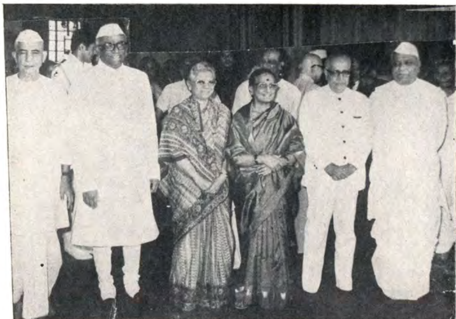
राष्ट्रपती भवनात पंतप्रधान आणि उपपंतप्रधान