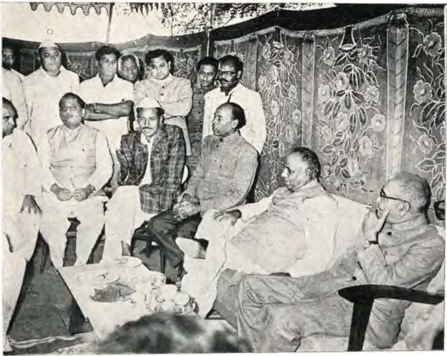
कवि ना. धों. महानोर यांच्या 'रानातल्या कवितां'ची मैफल