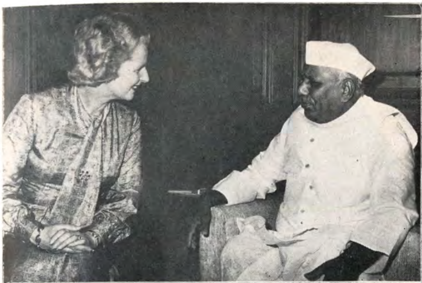
ब्रिटनच्या पंतप्रधान श्रीमती मार्गारेट थॅचर यांच्या समवेत